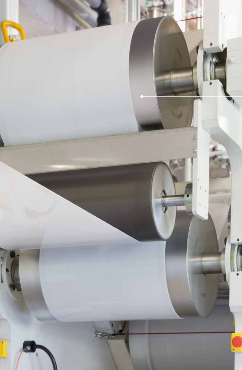
Kalanderanlage in Brilon