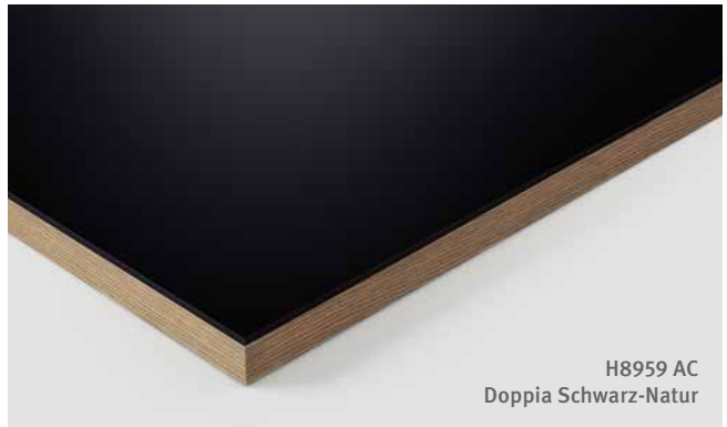
H8959 AC Doppia Schwarz-Natur