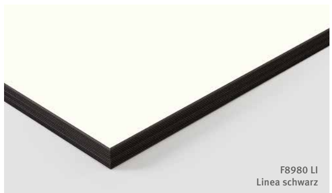
F8980 LI Linea schwarz