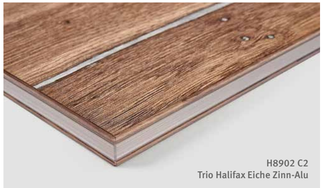
H8902 C2 Trio Halifax Eiche Zinn-Alu