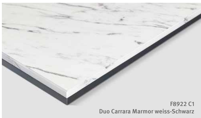
F8922 C1 Duo Carrara Marmor weiss-Schwarz