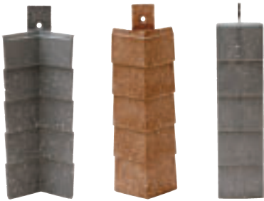
Verbinder und Kappen sind in sämtlichen Paneelfarben erhältlich.

Eine vollständige und flexible Lösung für Fassadenverkleidungen, die den unterschiedlichsten Design-Anforderungen von Gebäuden gerecht wird.